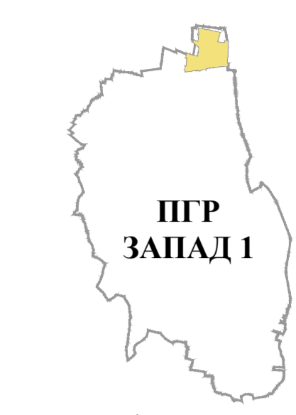
положај планског подручја у односу на план вишег реда