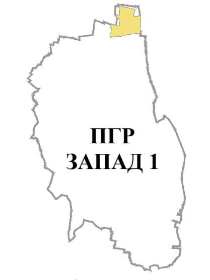
положај планског подручја у односу на план вишег реда