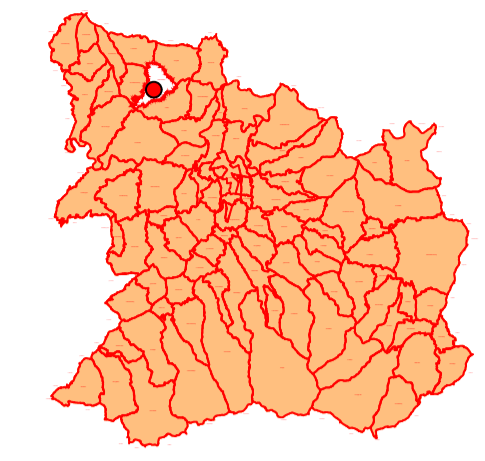
положај планског подручја у обухвату ПП Крушевац