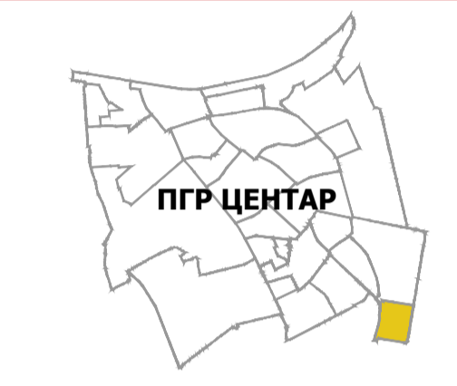
положај планског подручја у односу на план вишег рада