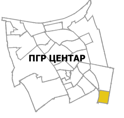
положај планског подручја у односу на план вишег рада