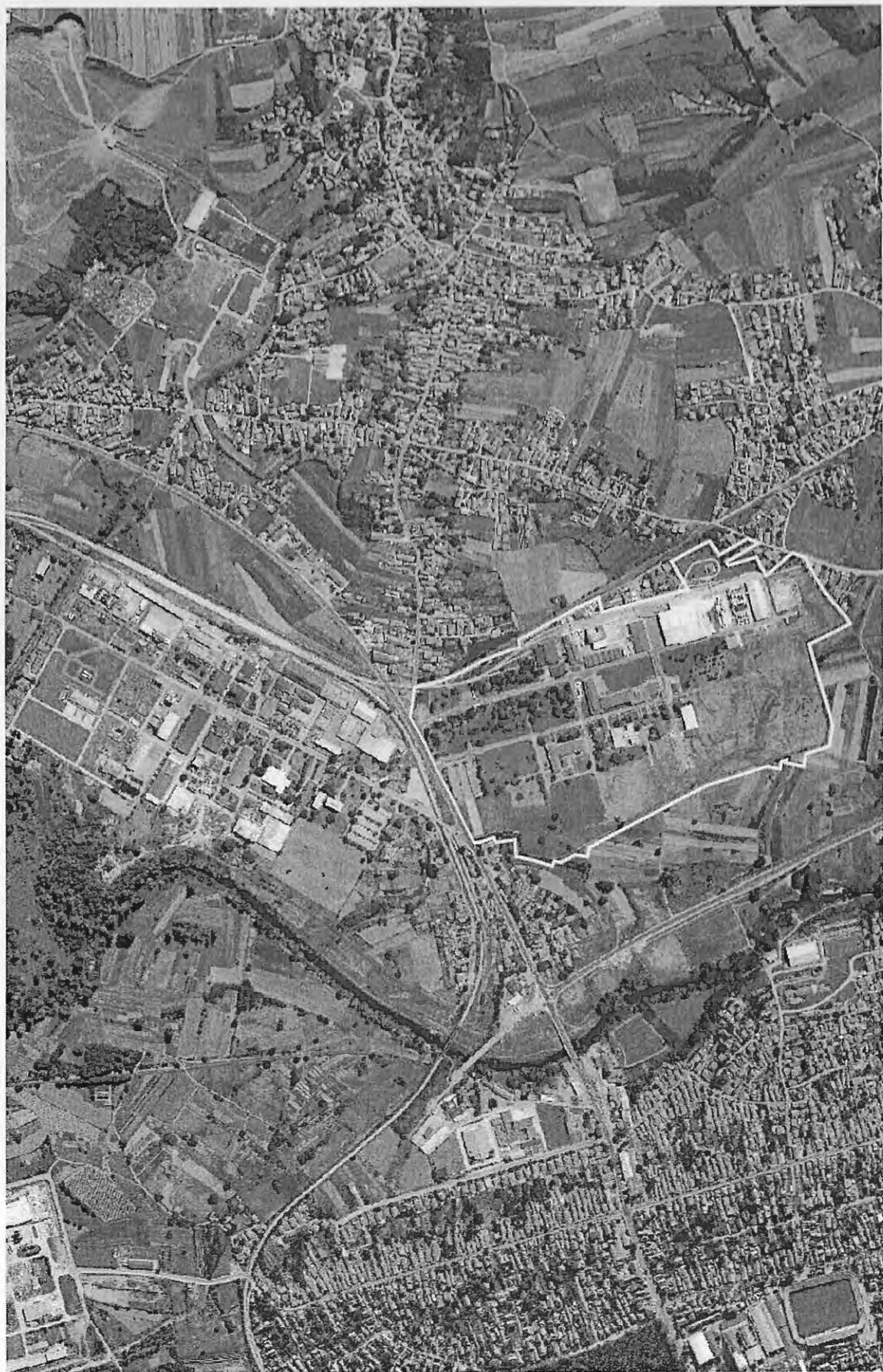
ГРАНИЦА ОБУХВАТА - ИЗМЕНЕ И ДОПУНЕ ППР ИСТОК 2 - У ДЕЛУ УРБ. ЦЕЛИНЕ 7.2