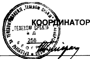
Мирослав Пиперац, дипл.инж.ел.